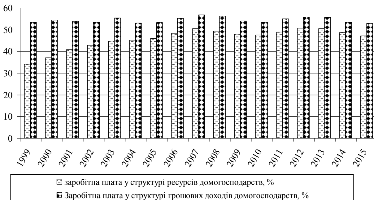
Рис. 1.1. Заробітна плата у структурі ресурсів та грошових доходів домогосподарств у 1999-2015 рр. (%)

Основним джерелом доходів населення в Україні, як і в багатьох інших країнах, виступає заробітна плата. За інформацією Державної статистичної служби України частка заробітної плати у структурі грошових доходів домогосподарств була достатньо сталою та складала від 53 % до 57 % (рис. 1.1).